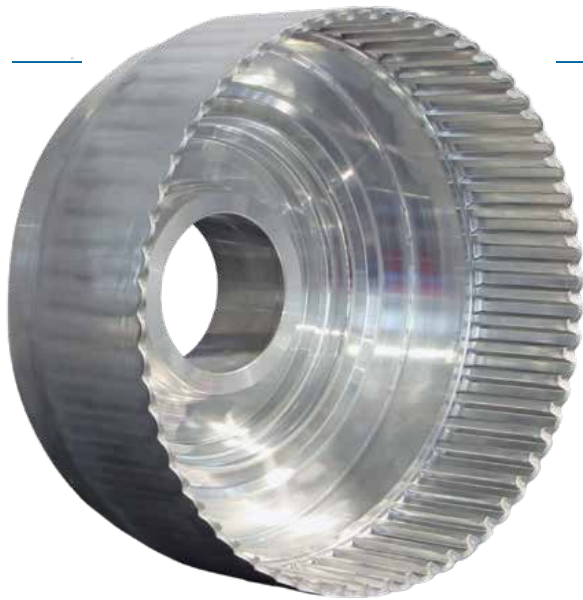
有内花键的中空铝制工件