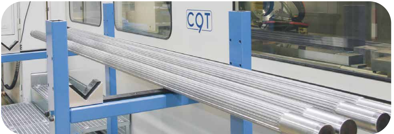
Verzahnte Wellen für Doppelschnecken-Extruder